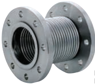
DN 15 - DN 500