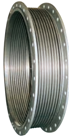
DN 600 - DN 2800